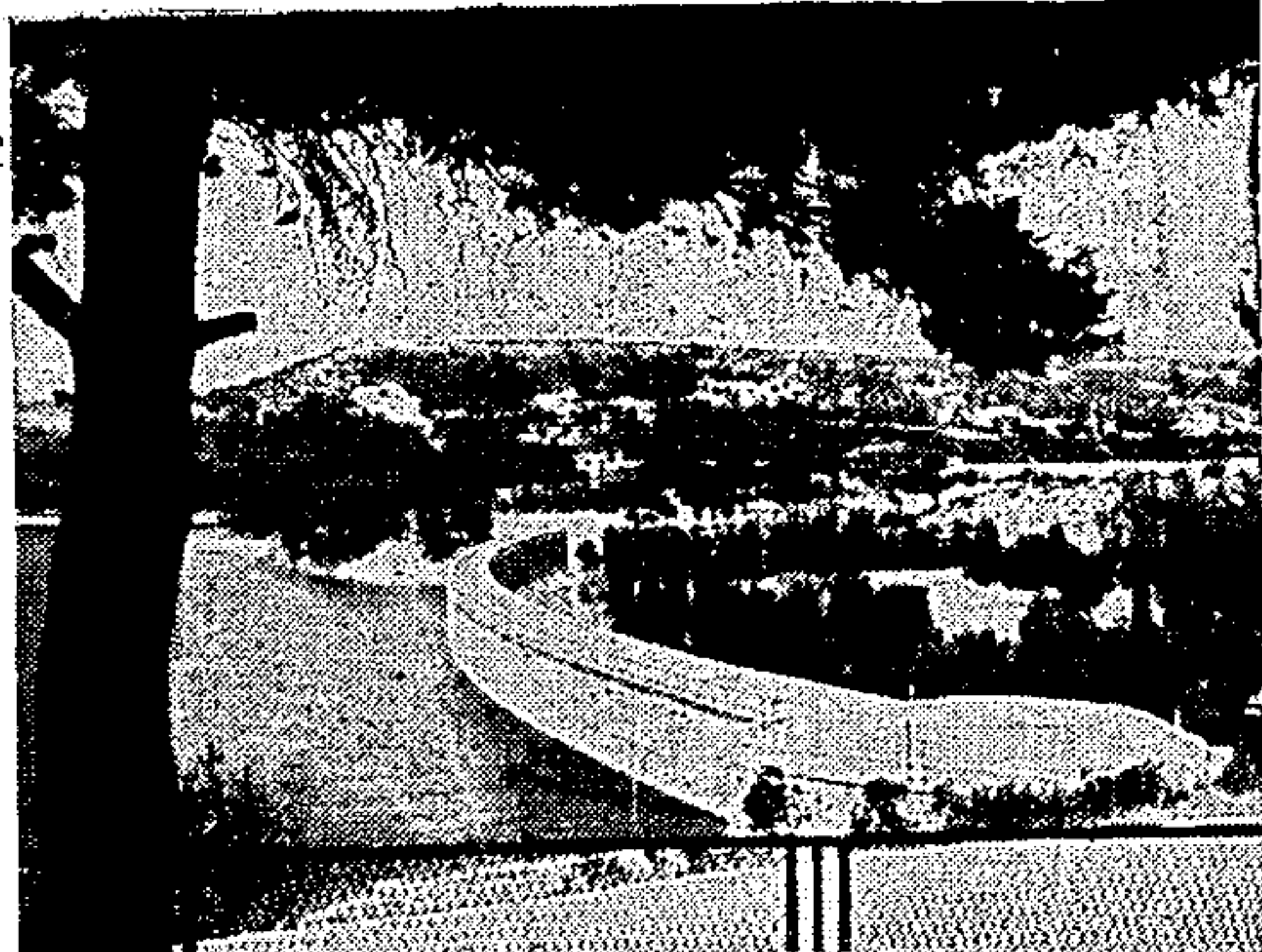
Μία ἑπιπέδου τῆς λίμνης τοῦ Μαραθῶνος, εἰς τὴν ὁποίαν ἐκτελεῖται τὸ ἐπεξεργαστικὸν μὴ πενταπλάσιον ἔργον.